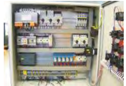
SPS-Steuerung / PLC-Control