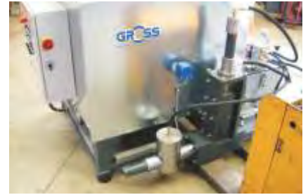
Einfacher Transport / Easy transport