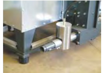
Transportrohr-Anschluss Transport pipe connection