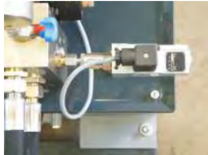
Einstellbarer Preßdruck Adjustable pressure