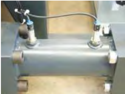
Verschleißfreie elektronische Sensoren Nonwearing electronic sensors