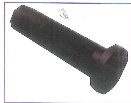
Presskanalbuchse gehärtet und austauschbar